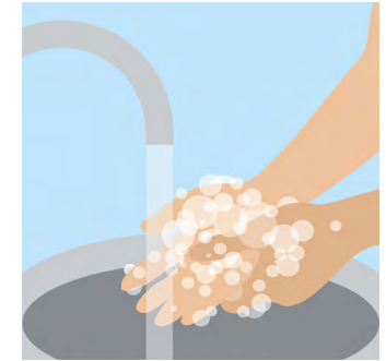
ຂັ້ນຕອນທີ 10: ລ້າງ ຫລື ທຳ ຄວາມສະອາດມືຂອງ ທ່ານອີກຄັ້ງ.