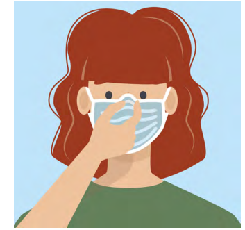
ຂັ້ນຕອນທີ 5: ໜ້າກາກບາງຊະນິດ ດ້ານເທິງຂອງ ມັນສາມາດປິດໄດ້. ເອົາມືແຕະດ້ານ ເທິງຂອງໜ້າກາກເພື່ອເຮັດ ໃຫ້ມັນແໜ້ນພໍດີກັບດັງຂອງທ່ານ.