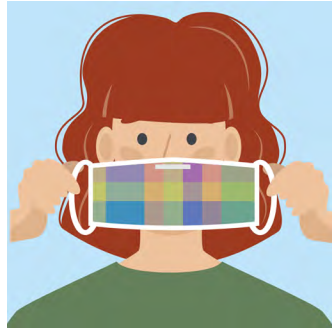
ຂັ້ນຕອນທີ 2: ໃຫ້ແນ່ ໃຈວ່າດ້ານເທິງຂອງໜ້າກາກໃຫ້ ປົກຢູ່ເໜືອດັງຂອງທ່ານ ແລະ ດ້ານລຸ່ມ ໃຫ້ຢູ່ກ້ອງຄາງຂອງທ່ານ.