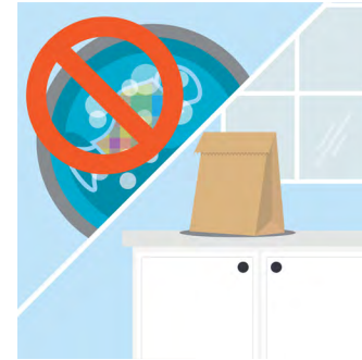
ຂັ້ນຕອນທີ 9: ຖ້າທ່ານໃຊ້ຜ້າປິດ ປາກປະເພດ N95/KN95 ແລະ ກັບຄືນມາໃຊ້ອີກຄັ້ງ, ໃຫ້ເກັບໄວ້ ໃນ ຖົງເປັນຢ່າງດີ. ຫ້າມຊັກ.