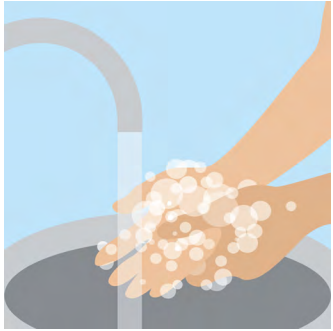
ຂັ້ນຕອນທີ 1: ລ້າງ ຫລື ທຳ ຄວາມສະອາດມືຂອງທ່ານ.