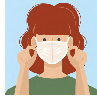
ຂັ້ນຕອນທີ 4: ເຄື່ອນຍ້າຍໜ້າ ກາກ ເພື່ອໃຫ້ຫຸ້ມດັງ, ປາກ ແລະ ຄາງຢ່າງດີ.