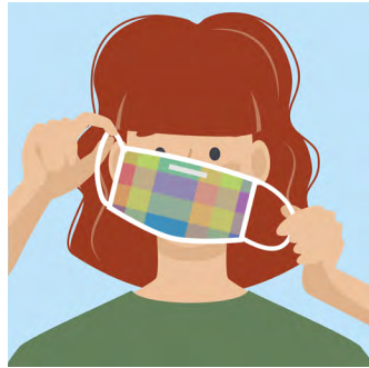
ຂັ້ນຕອນທີ 7: ດຶງສາຍເກາະຫູ ຫລື ສາຍມັດ ຖ້າທ່ານຕ້ອງການ ປິດອອກ. ຫ້າມຈັບທາງໜ້າຂອງ ໜ້າກາກ.