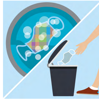
ຂັ້ນຕອນທີ 8: ຊັກຜ້າປິດປາກ ຊະນິດຊັກໄດ້ໃນໄລຍະທີ່ມີການ ໃຊ້ງານ. ໃຫ້ຖິ້ມທັນທີຫຼັງຈາກ ທີ່ໃຊ້ຜ້າປິດປາກຊະນິດໃຊ້ແລ້ວ ຖິ້ມ.