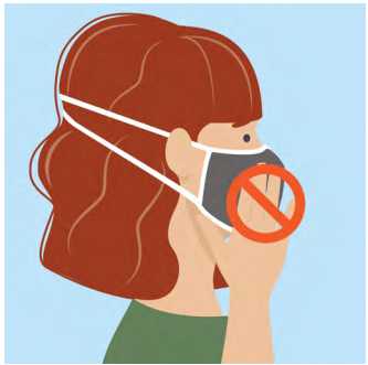
ຂັ້ນຕອນທີ 6: ຫ້າມຈັບໜ້າ ກາກໃນຂະນະທີ່ທ່ານກຳລັງ ໃສ່ຢູ່. ປັບສາຍເກາະທີ່ຫູ ຫຼື ສາຍມັດ ຖ້າທ່ານຕ້ອງການປັບ ໃຫ້ມັນພໍດີ.